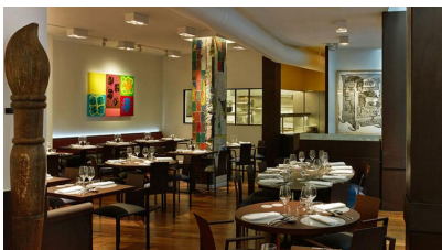
Salle du restaurant Ze Kitchen Galerie