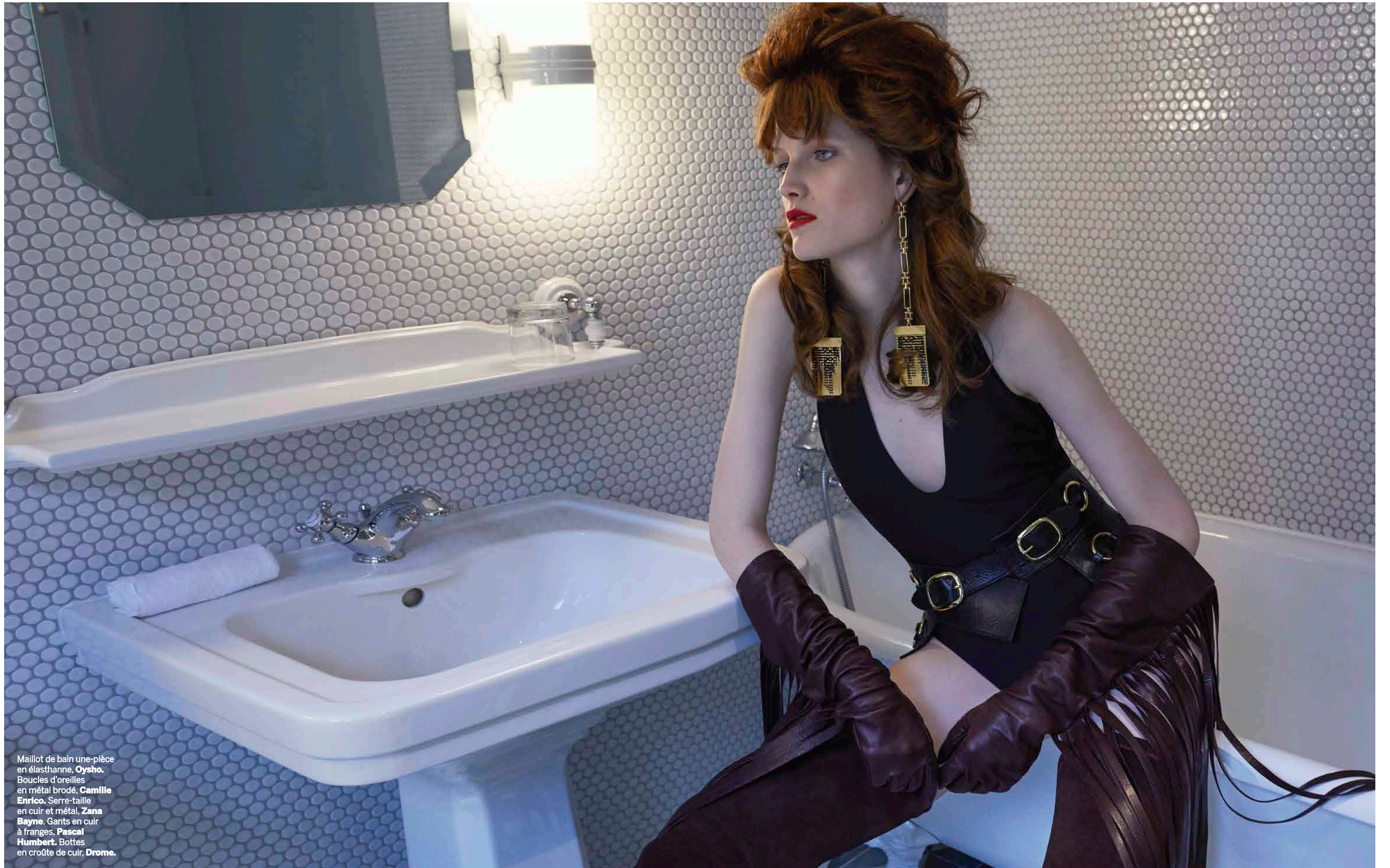
Maillot de bain une-pièce en élasthanne, Oysho . Boucles d'oreilles en métal brodé, Camille Enrico . Serre-taille en cuir et métal, Zana Bayne . Gants en cuir à franges, Pascal Humbert . Bottes en croûte de cuir, Drome .